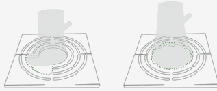
a diferentes diámetros de los árboles