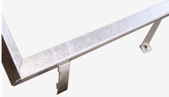
Marc angular de acero, L45°