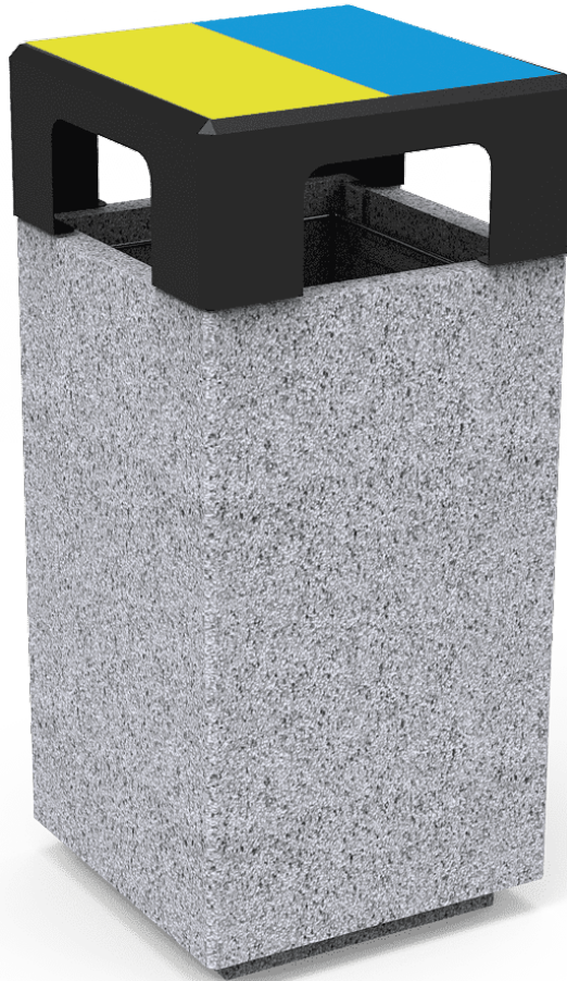
PAPELERA KUBE SELECTIF PA672S3