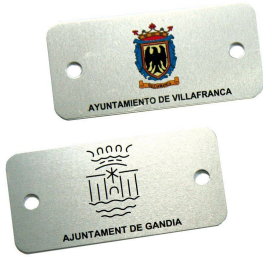
Plaqueta aluminio 74 x 35 mm.