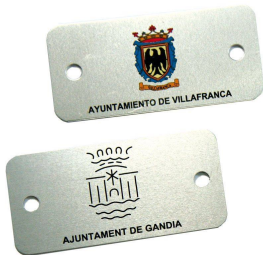
Plaqueta aluminio 74 x 35 mm.