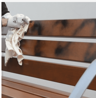
Protector for materials from paints, graffiti ....