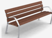
NeoBarcino ReBnew UM304NPRH