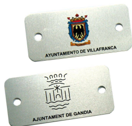
Plaqueta aluminio 74 x 35 mm.