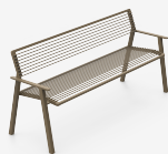
CORO METAL UM3D74