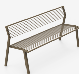
CORO METAL UM3D72