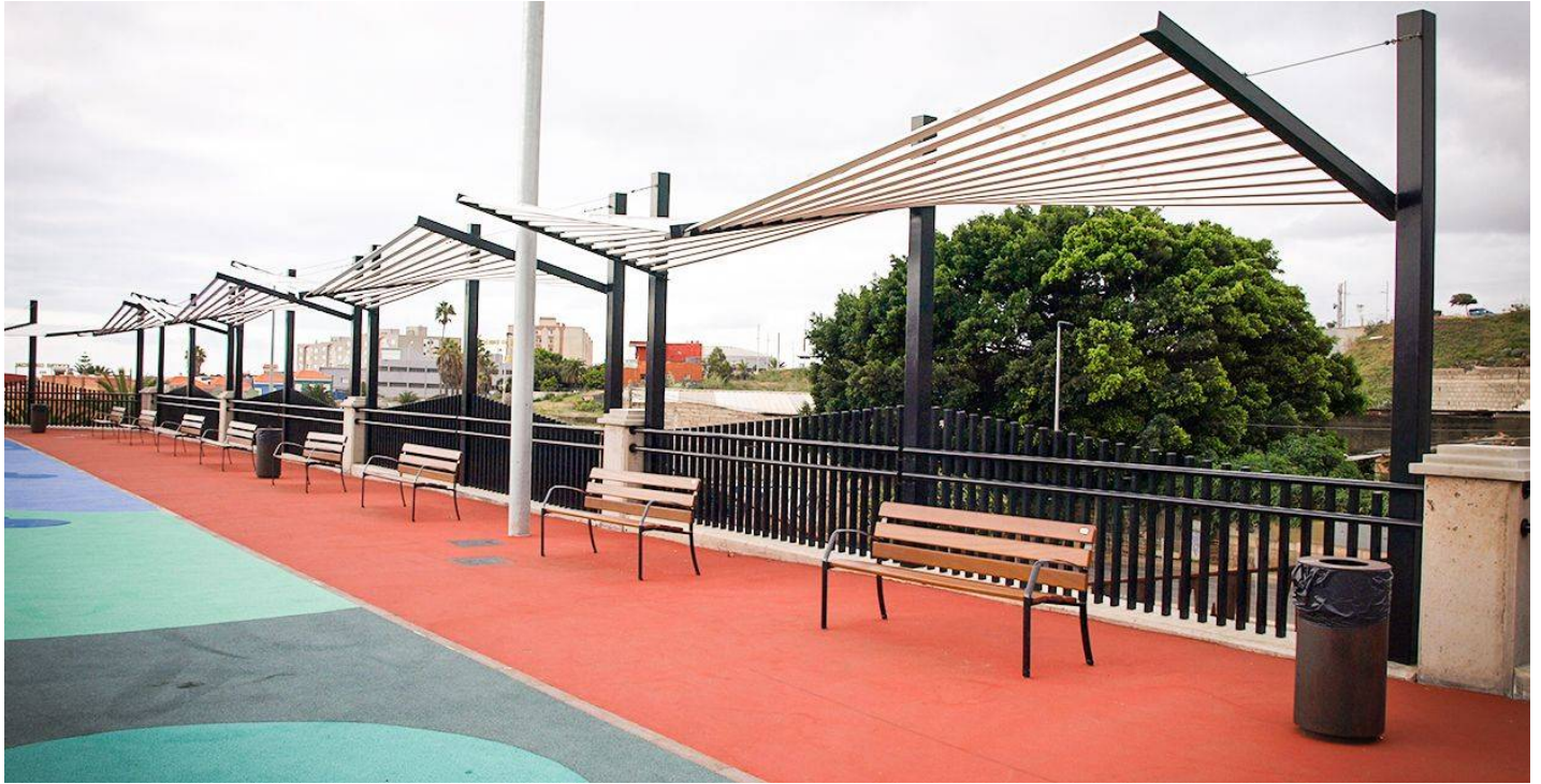
Atlas Doble UM511-2M

Canarias instala una gran variedad de productos de BENITO en uno de sus parques para crear zonas de descanso y asegurar la correcta iluminación del lugar.