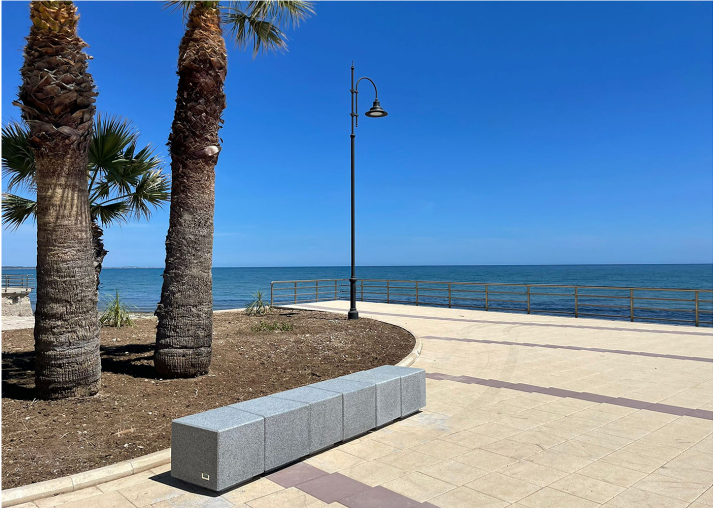
Kube Kurve UM372SK

BENITO instala bancos de hormigón de gran resistencia en la costa siciliana para dar modernidad al entorno.