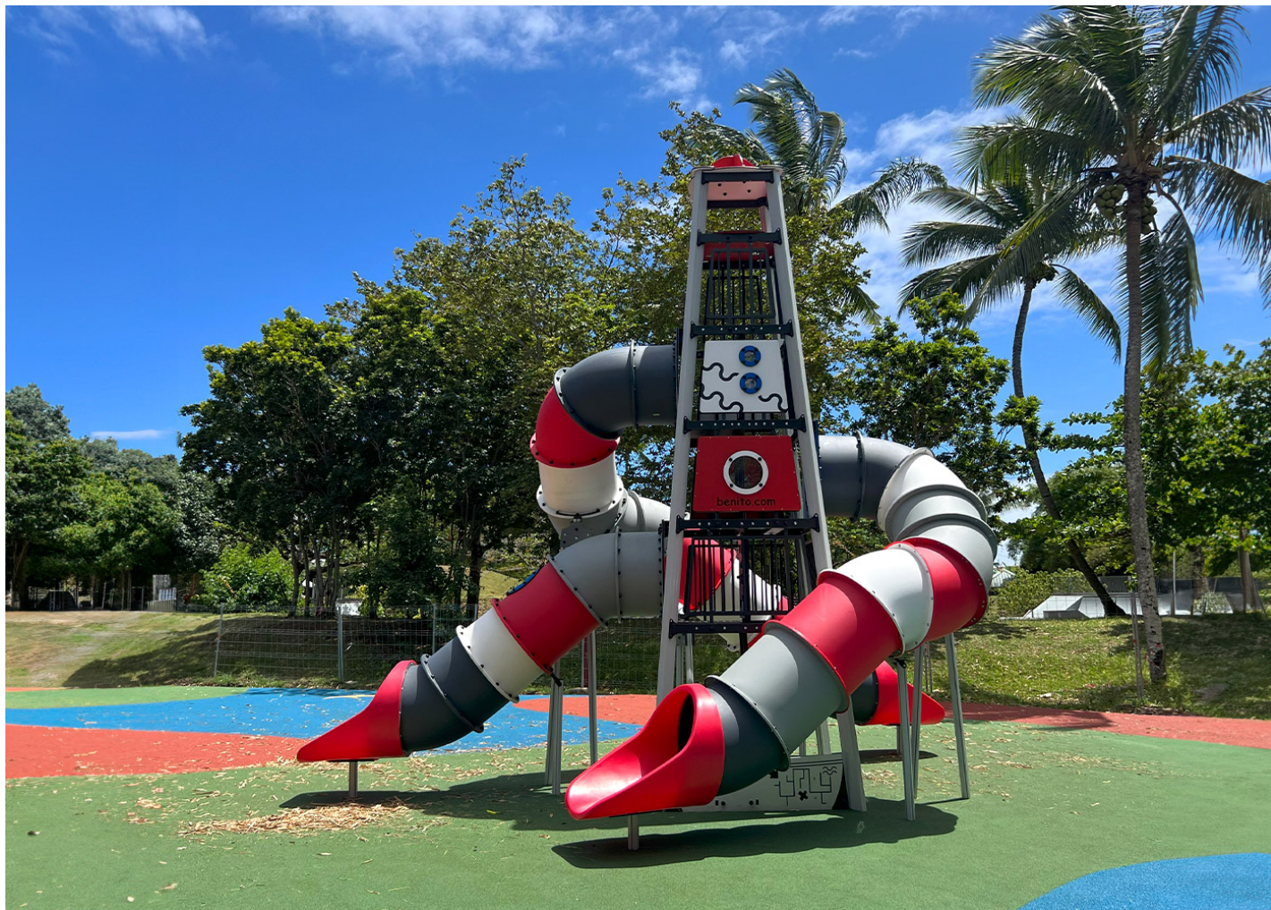
Faro Mariner JTEM02

La isla La Réunion tiene un nuevo faro: el gran juego que representa un faro mariner de BENITO.